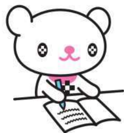
大学マスコット「プラスちゃん」